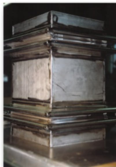
Rechteckkompensator Werkstoff: 1.4571