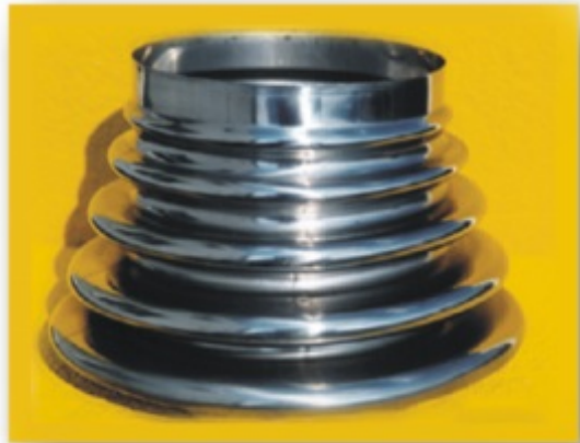
Sonderbalg für die Schwingungstechnik