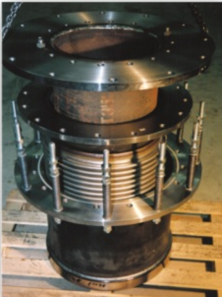
Sonderkompensator Werkstoff 1.4541/15MO3

Wir bieten beste Lösungen in Konstruktion, Produktionsverfahren und Service von der Planungs- bis zur Ausführungsphase an.