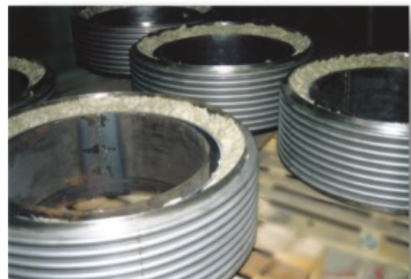
Universalkompensatoren mit Hardoxleitrohr und Isolierpackung