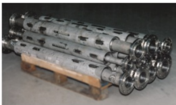
Sonderkompensatoren mit Hubbegrenzungen komplett Edelstahl, 100% Röntgen